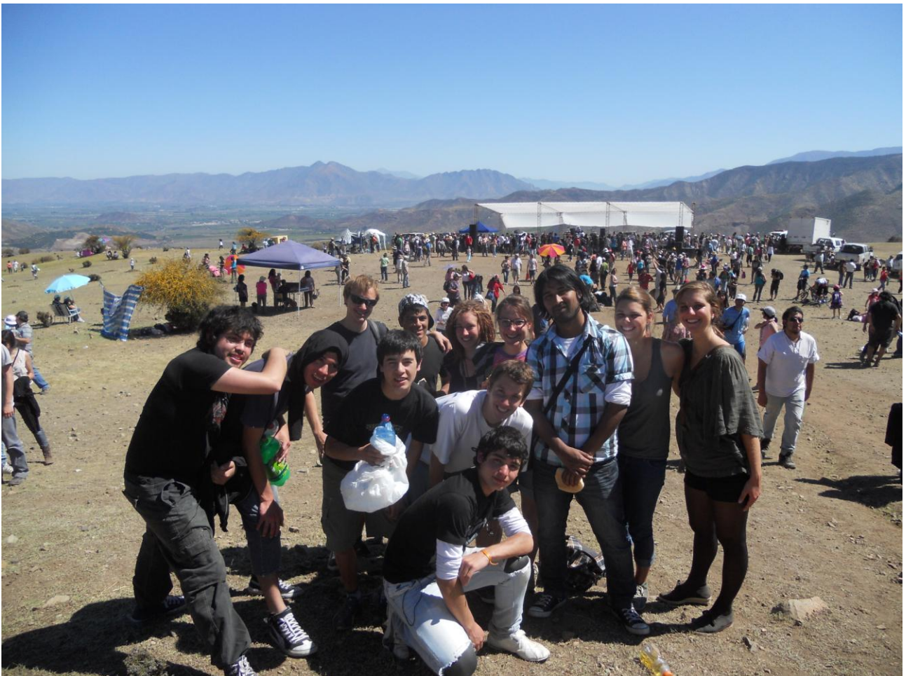
Konzert der chilenischen Band „Inti Illimani“ in Santa Maria