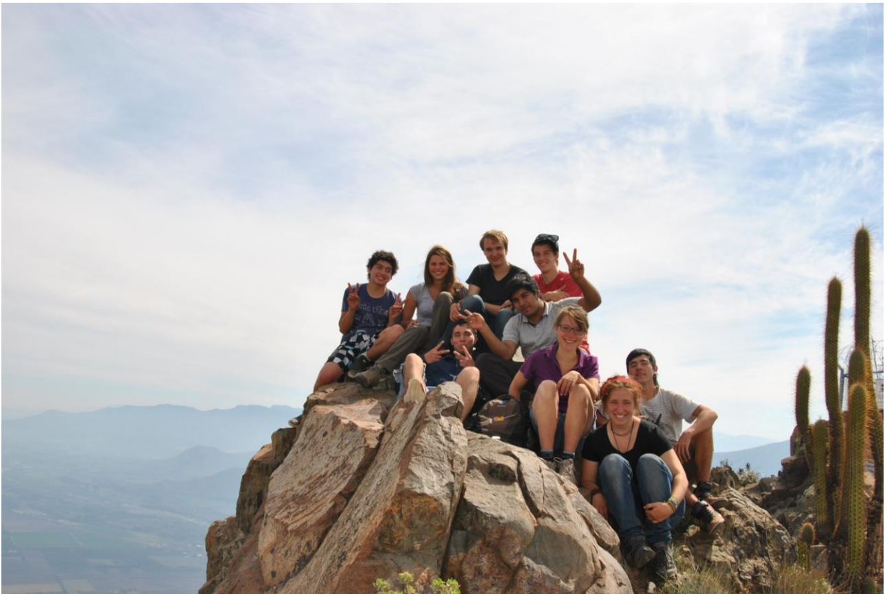
Auf dem Gipfel des „La Giganta“ zusammen mit den Casajungs