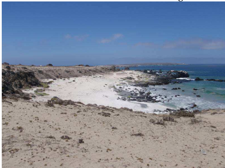
Strand bei „Punta de Choros“