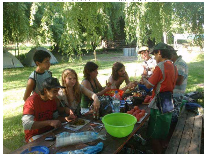
Kartoffelsalatschnipseln mit der Casa