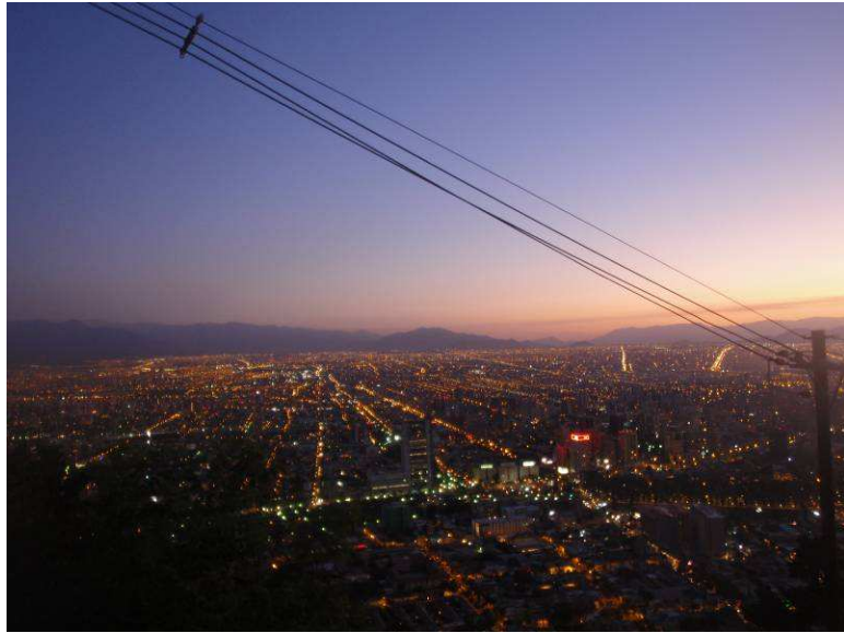
Das Fensterlichtermeer von Santiago