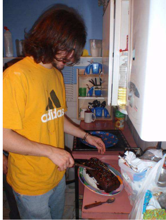
backen im Pablo Sexto