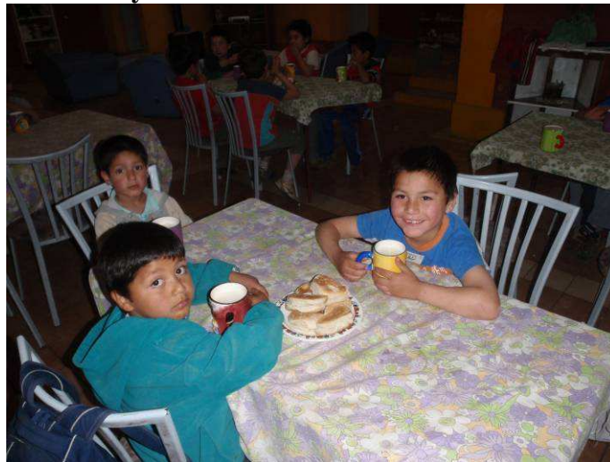
Abendessen im Pablo Sexto