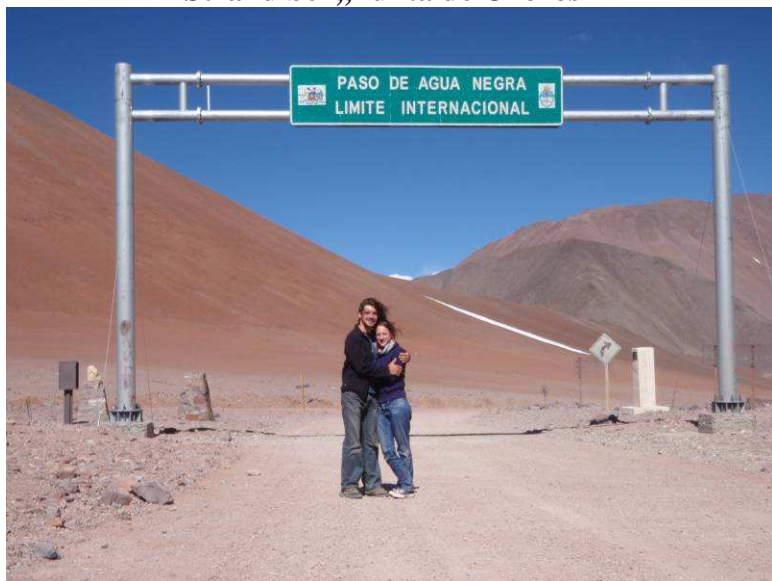
„Paso Agua Negra“