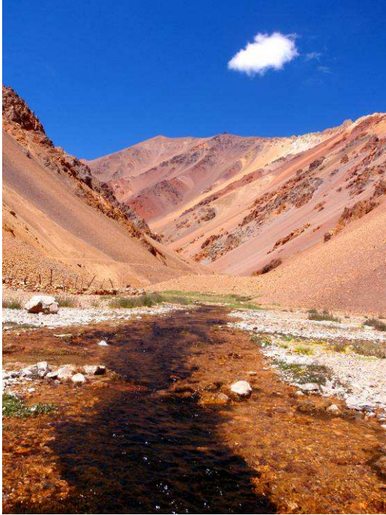
Der goldene Canyon